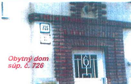
Obytný dom súp. č. 726