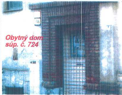
Obytný dom súp. č. 724