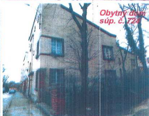
Obytný dom súp. č. 724