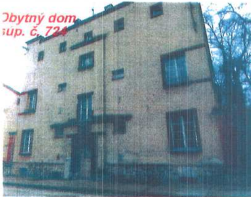
Obytný dom súp. č. 724