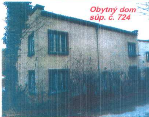
Obytný dom súp. č. 724