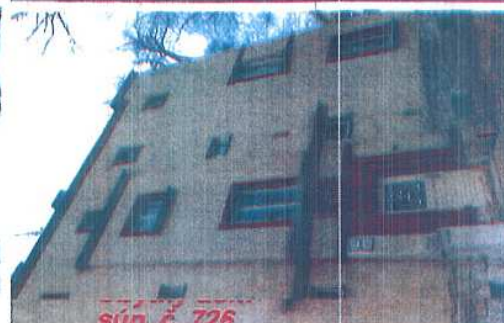
súp. č. 726