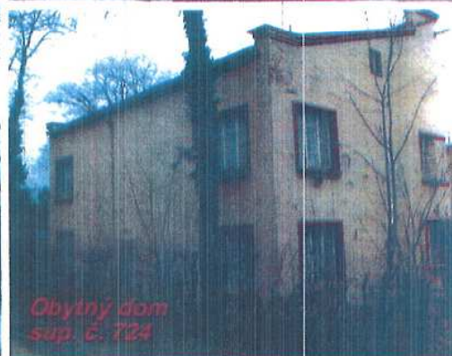
Obytný dom súp. č. 724