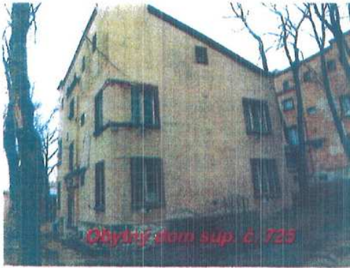
Obytný dom súp. č. 723